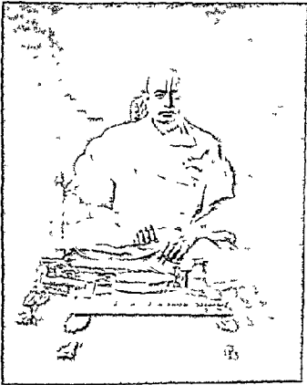
गोस्वामी १००८ श्रीगोकुलनाथजी महाराज